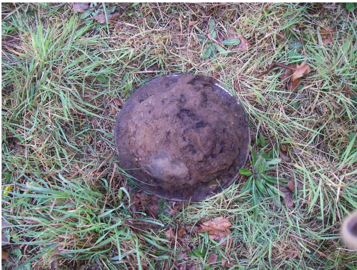
Afbeelding 3.3: de helm uit werkput 2 vanboven af gefotografeerd.

Eigendom: de helm is na telefonisch overleg met de depotbeheerder van de Provincie Gelderland, Dr. Stefan Weiss-König, gedeselecteerd en wordt niet als archeologisch vondst beoordeeld. De omgang met mobiel oorlogserfgoed is wat betreft geallieerd materiaal als volgt geregeld: