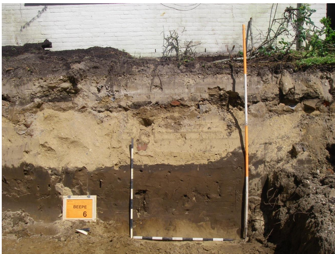
Afbeelding 3.1: Profielkolom 2.1.

De profielopbouw is binnen het hele onderzoeksgebied in grote lijnen uniform. De kolom in werkput 2 (afbeelding 3.1) geeft een representatief beeld van de stratigrafie. Aan de basis van de profielen is licht geelgrijs, matig siltig, matig fijn zand aangetroffen. Dit zand is geïnterpreteerd als dekzand, de C-horizont. Er is geen sprake van een podzolbodemp die zich kenmerkt door een humeuze, donkere bovengrond (Ap-horizont), die circa 25 cm dik is, waaronder een lichtgrijze E-horizont (uitspoelingshorizont) aanwezig is. Hieronder ligt de bruingekleurde B-horizont (inspoelingshorizont), die geleidelijk overgaat in de C-horizont. Ten gevolge van de vroegere bodembewerking is de oorspronkelijke A-, E- en/of B-horizont in het plaggendek opgenomen. In de top van de C-horizont zijn slechts geringe tekenen van inspoeling waargenomen. Op deze natuurlijke afzettingen is in de werkputten 2 en 3 een 20 tot 50 cm dik pakket matig fijn tot matig grof humeus, donkerbruin zand aangetroffen, het esdek (Aa-horizont). Op het esdek - dat in werkput 1 ontbreekt - ligt een recent ophogingspakket bestaande uit zand en bouwpuin (baksteen en betonfunderingen).