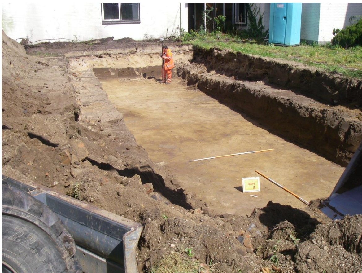
Afbeelding 3.2: werkput 1 vanuit het westen gefotografeerd.

Tijdens het onderzoek zijn geen archeologisch relevante sporen en vondsten aangetroffen. Het gebied is sterk verstoord in de moderne tijd. Alleen in de werkputten 2 en 3 is nog een restant van het esdek aangetroffen. In alle werkputten ligt het vlak in de C-horizont tussen 0,8 en 1,2 m – MV.